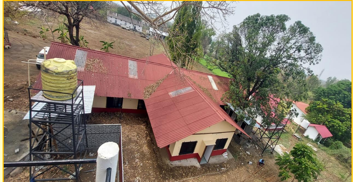
Shradhdhawan Center in collaboration with Amtes Maharogi Seva Samiti & Psychiatric Society, Nagpur