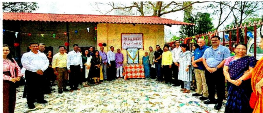
Shradhdhavan Centre, Nagpur is a home is dedicated only for the wandering mentally ill.